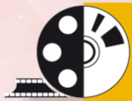
IMAGEN Y SONIDO

PROGRAMACIÓN DE LOS CICLOS FORMATIVOS DE FORMACIÓN PROFESIONAL